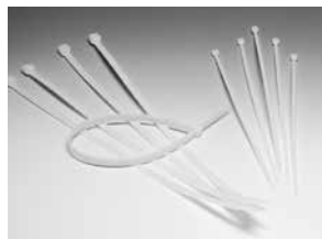
QuickFix Band t.b.v. montage flexibele verbindingen