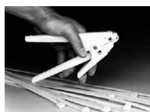
Quickfix Tang t.b.v. montage