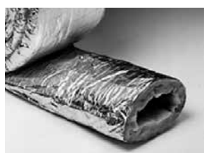
Type XIH, isolatiehoezen met 25 mm isolatie (niet dampdicht)