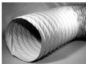
Type XP, ongeïsoleerd