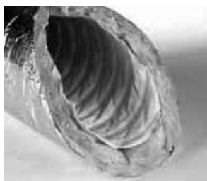
Type XPA, akoestisch en thermisch geïsoleerd