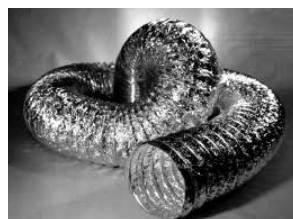
Type XFF, ongeïsoleerd, 2 laags