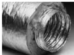
Type XFFT, thermisch geïsoleerd, 2 laags