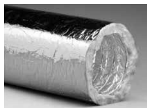
Type XFFAP, akoestisch en thermisch geïsoleerd, 2 laags met folie