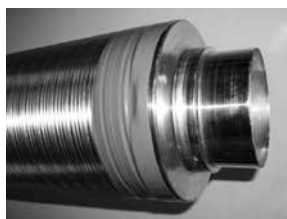
Type AFGD, semi-flexibele aluminium geluiddemper