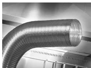
Type AF, semi-flexibele aluminium slang