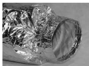
XPA, akoestisch geïsoleerd 1 meter