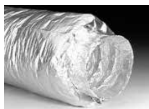
XFFAP, dubbellaags akoestisch geïsoleerd, 1 meter en 0,5 meter